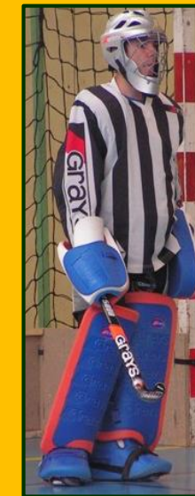
Rémy Gardien du HC Jalles

En gazon ou synthétique, en salle ou sur un terrain type Hand, on trouve devant chaque but un demi-cercle appelé cercle d'envoi.