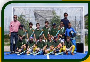
Equipe U12 2018-2019 du HC JALLES